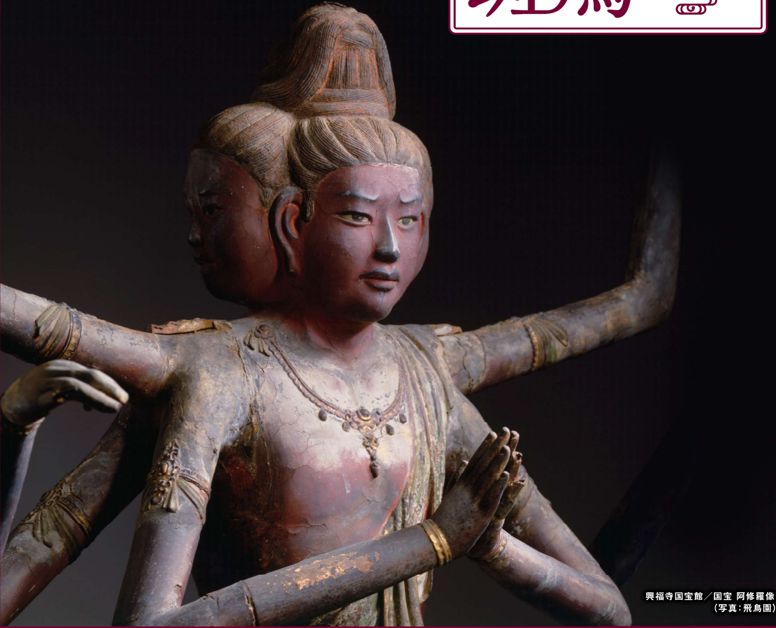
興福寺国宝館 / 国宝 阿修羅像